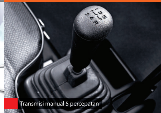
Transmisi manual 5 percepatan