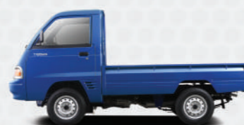
Deep Blue Mica