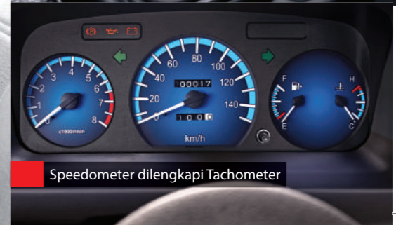
Speedometer dilengkapi Tachometer