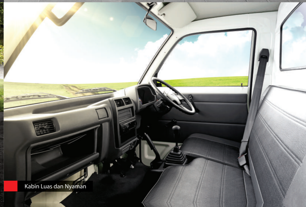
Kabin Luas dan Nyaman