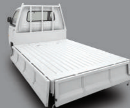
3 Way Wide Deck