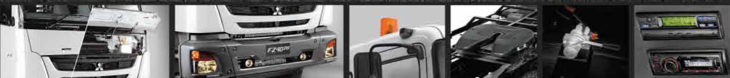
Front Panel 3 Pieces Bumper Rotary Light Coupler Trailer Brake Tachograph